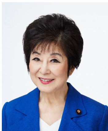
参議院議長 山東 昭子

秋篠宮皇嗣同妃両殿下の御臨席の下、行政相談委員制度 60 周年記念式典が開催されますことに、参議院を代表してお祝いを申し上げます。