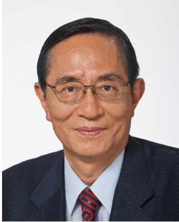
衆議院議長 細田 博之

本日、秋篠宮皇嗣同妃両殿下の御臨席を仰ぎ、行政相談委員制度 60 周年記念式典が開催されますことを、心からお慶び申し上げます。