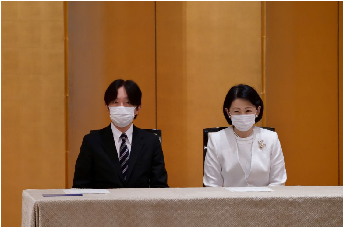
秋篠宮皇嗣同妃両殿下