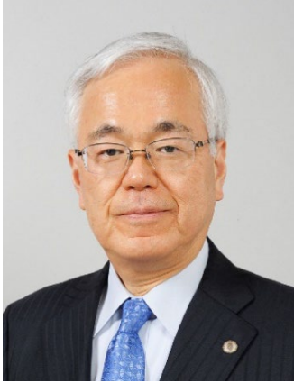
最高裁判所長官 戸倉 三郎

本日、秋篠宮皇嗣同妃両殿下の御臨席を仰ぎ、行政相談委員制度 60 周年記念式典が挙行されるに当たり、お祝いを申し上げます。