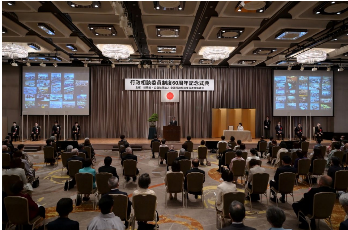
秋篠宮皇嗣殿下おことば